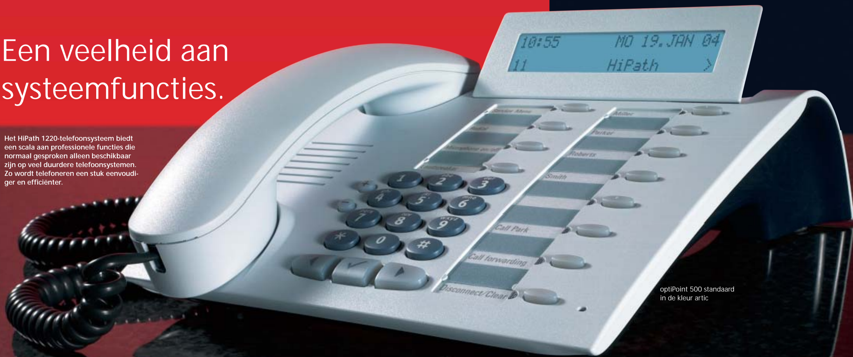
optiPoint 500 standaard in de kleur artic